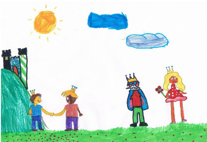
Ilustración: Aitor Moreno (9 años)

-¿Por qué me arrebatas la bolsita? ¡yo la vi primero!-